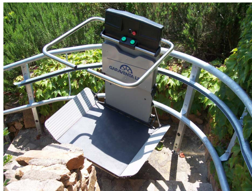
Accès du jardin