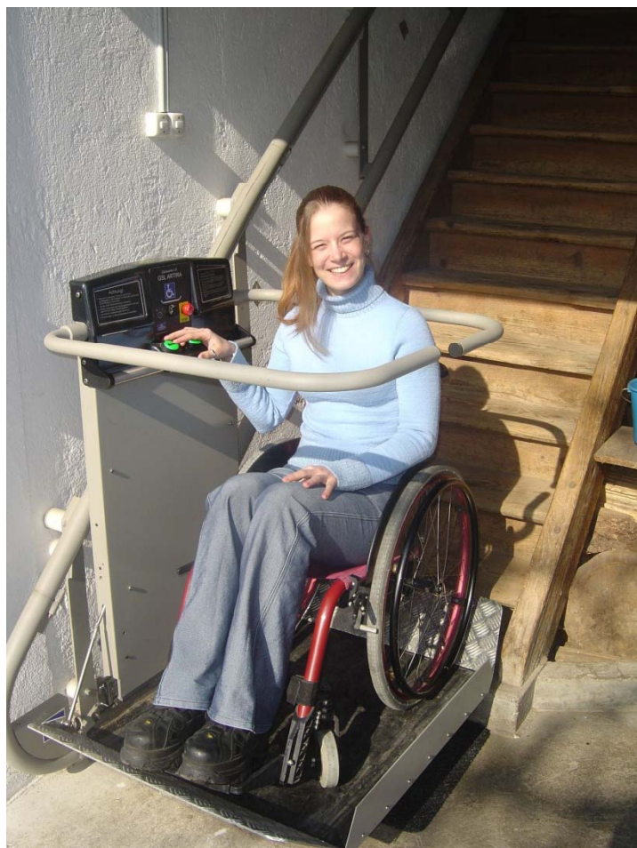
Accès à la maison