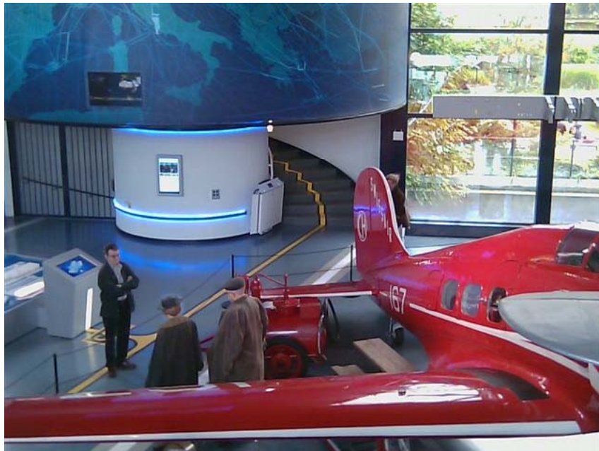
Musée des Transports, Lucerne Accès 2 ème étage